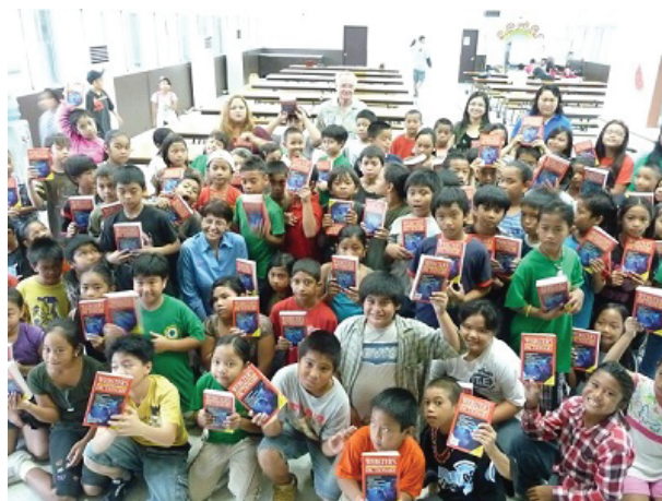
Третокласници на о. Сайпан с новите си лични речници от Ротари