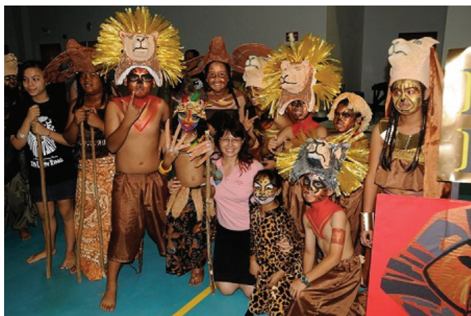
Елица с деца от постановка на „Цар Лъв“ по време на Парад на Книгата

- Активното промотиране на Ротари в местната общност. Клубът канеше почти за всяка среща интересни лектори и медиите, за които това беше възможност лесно да се срещнат с лекторите. Репортажите бяха от „среща на Ротари клуба“. Провеждаха се събития, които привличаха много участници и доброволци и имаха широк отклик – като забавно бягане на 5 км, чистене на плаж или парк, или просто приближаваха Ротари към хората, като декориран камион с бонбони за деца и възрастни на Хелоуин. Множество малки проекти като помощ за пострадали от пожар или одеяло и пакет с неща за първите седмици на бебето за новородени в местната болница помагаша местната общност да вижда активността на Ротари постоянно и не само в големи „скъпи“ проекти, прозрачност където отиват събраните средства и че Ротари е в постоянна служба на обществеността. Тази активност помагаше на хора и организации да се обръщат сами към нас с проблеми - потенциални проекти на Клуба.