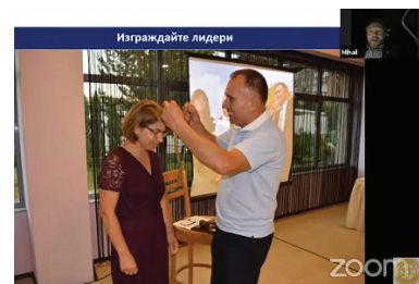
ВИРТУАЛЕН СЕМИНАР ЗА ЖИЗНЕН КЛУБ 30.11.-2.12.2020

Вдъхновяващи лектори представиха най-важното и актуалното свързано с развитието на членството, дейността на нашата Фондация Ротари и изграждането на положителния публичен имидж на нашата организация.